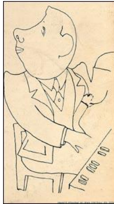
Poulenc dessiné par Cocteau

FRANCIS POULENC (1899-1963) Sonate pour flûte et piano I. Allegretto malinconico II. Cantilena III. Presto giocoso