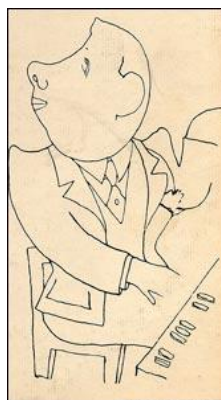
Poulenc dessiné par Cocteau

GABRIEL FAURÉ (1845-1924) Berceuse op. 16 pour violon et piano